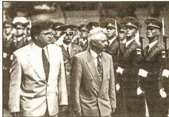
Lietuvos kariai pagerbia J. Kosmo (dešinėje) ir L. Linkevičių.

Rugpjūčio 8 d. Norvegijos gynybos ministras Jorgenas Kosmo atvyko į Vilnių oficialaus vizito. Svečią Vilniaus aerouoste pasitiko Lietuvos krašto apsaugos ministras L.Linkevičius.