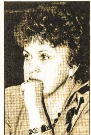
Lietuvos moterų partijos pirmininkė K. Prunskienė

Seimo narys Valdas Petrauskas teigė pareiškęs nesitikimą su problemos politizavimu. Petrauskas pažymėjo, kad tai yra teisiniai reikalai, nes yra „konkretūs straipsniai, konkretūs nusikaltimai ir konkreti atsakomybė“.