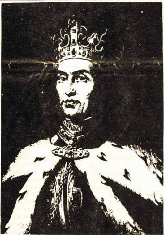
Vytautas Didysis 1392-1430