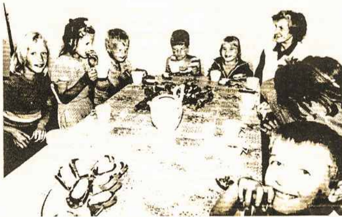
Vargšų vaikų maitinimas Sv.Vincento parapijoje Marijampolėje