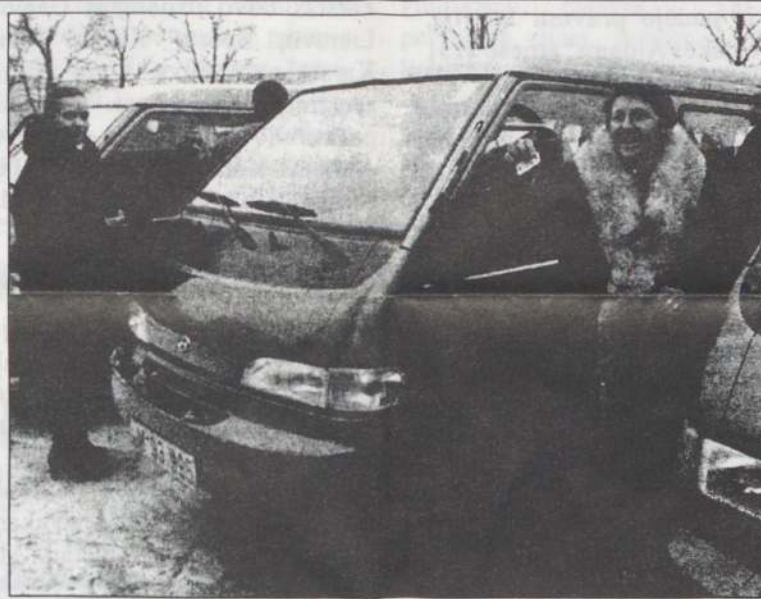
Laimingos mamos prie dovanotų mikroautobusų.