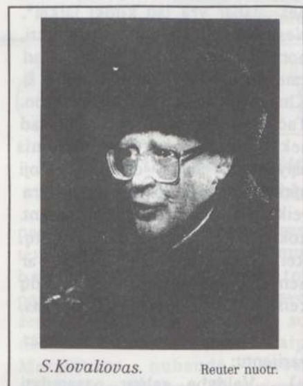
S.Kovaliovas.