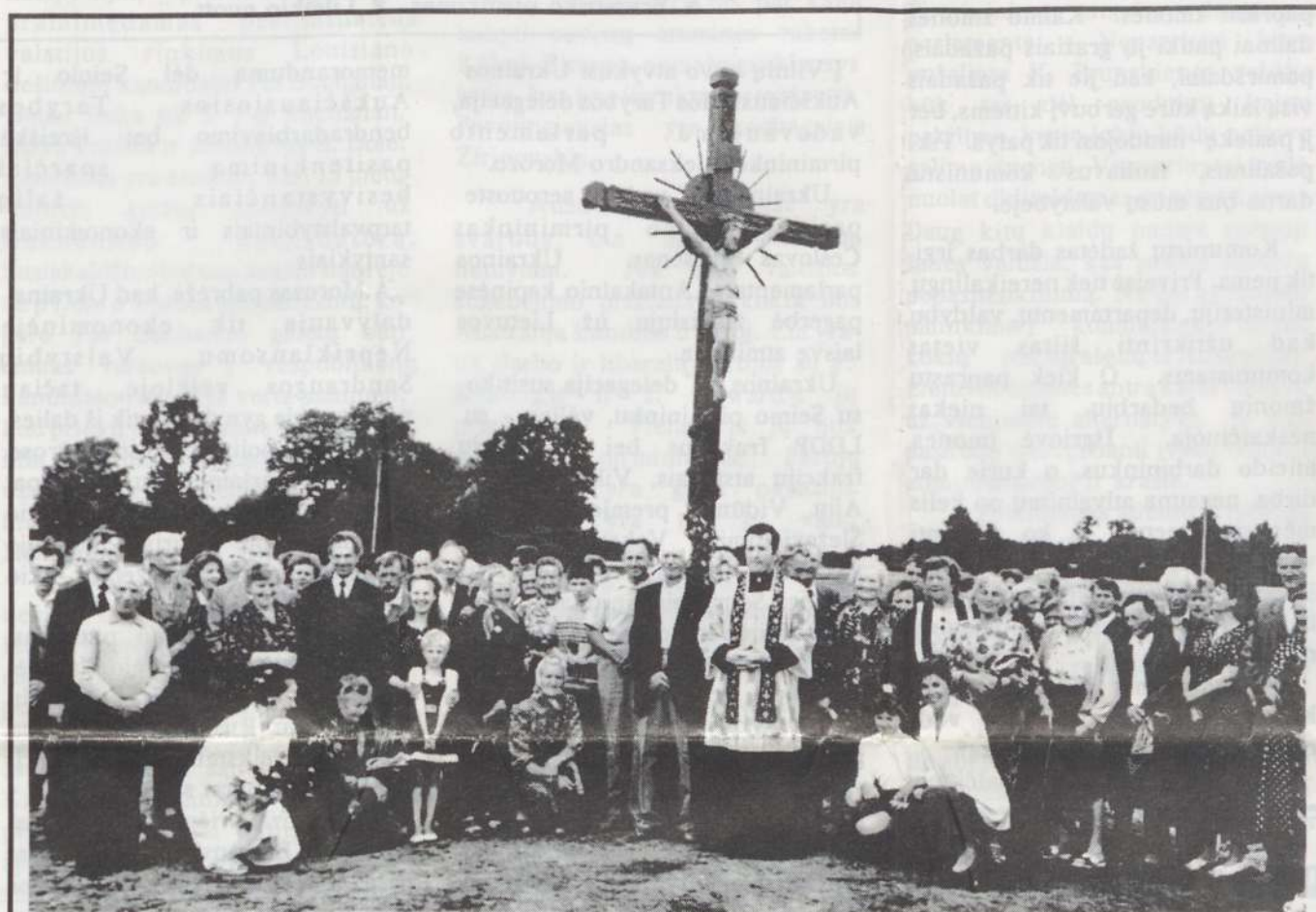
Karališkių kaime (Šakių apskr.) prie pašventinto kryžiaus, komunistų nukankintiems kaimo gyventojams prisiminti.