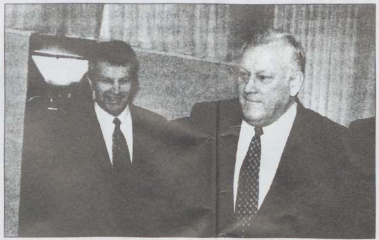
Ukrainos parlamento vadovo A. Morozo ir Lietuvos Prezidento A. Brazauskos susitikimas.

Į Vilnių buvo atvykusi Ukrainos Aukščiausiosios Tarybos delegacija, vadovaujama parlamento pirmininko Aleksandro Morozo.