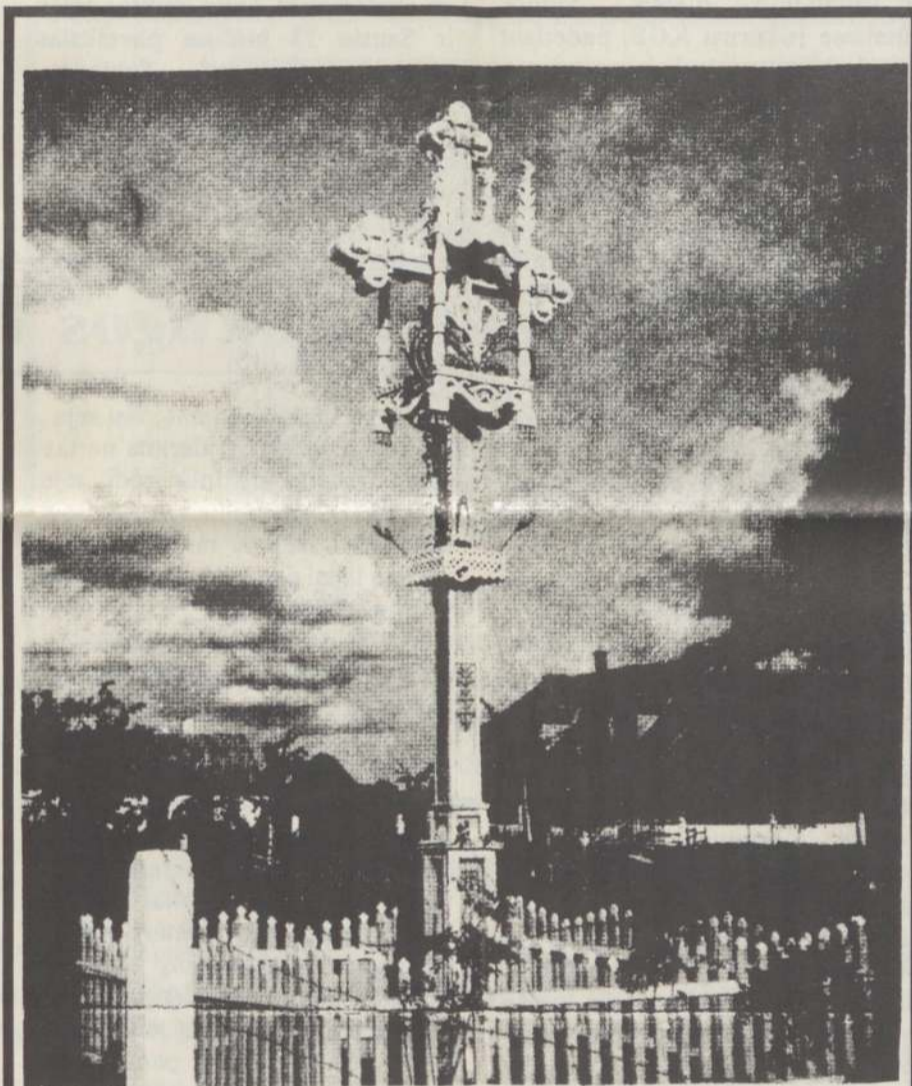
Sodybos kryžius Nepriklausomais Lietuvos laikais

Tokių palankių aplinkybių skatinama, lietuvių tauta suvokė savo pačios stebuklą: egzistencijos syvai dar neišdžiūvę. Tad atrastas didžiulis dvasinis salynas, kuriame