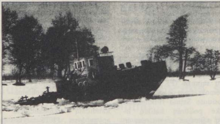
Ledlaužis „Stumbras“ laužia Atmatos upės ledus.