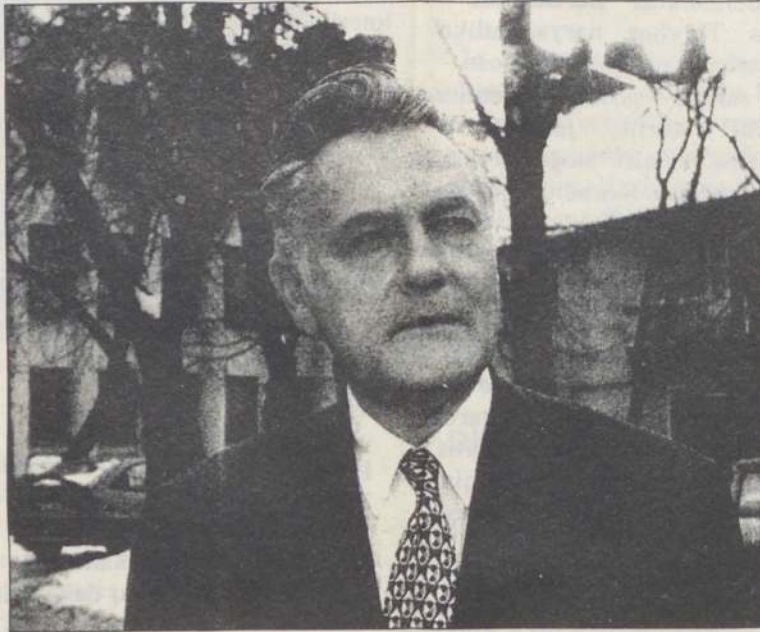
V. Adamkus daug vilčių sieja su nauju Seimu.

- Nesu pasiryžęs nešti bet kokią vėliavą - tik tą, kuri atstovauja Lietuvos valstybingumui ir gerovei. Nemanau, kad Tėvynės sąjunga yra laiminga dėl to, kad aš dalyvauju Lietuvos visuomeniniame gyvenime. Jau nekalbant apie LDDP, kurią aš viešai paskelbiau esančia atsakinga už dabartinę padėtį Lietuvoje. Ją laikau diktatūrine partija, demokratinuose