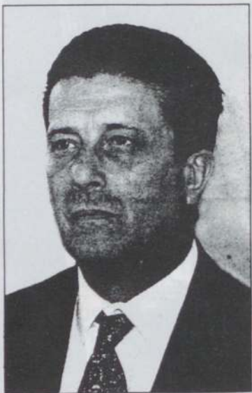
UNESCO generalinis direktorius F. Mayor.

UNESCO vadovas pabrėžė, kad ši organizacija remia Lietuvos pastangas spartinti Senamiesčio atstatymo procesą, kuriam paramą suteiks įvairios tarptautinės finansų