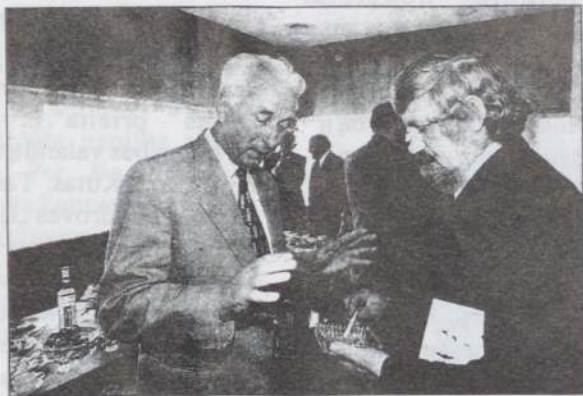
Per suvažiavimo pertrauką svečiai galėjo pasivaikšinti ir padiskutuoti. Prie stalo – žemės ūkio ministras V. Einoris (kairėje) ir Lietuvos laisvės sąjungos pirmininkas V. Štustauskas.