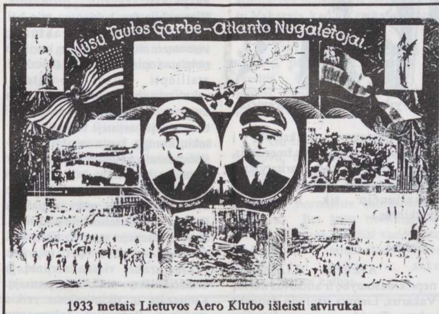
1933 metais Lietuvos Aero Klubo išleisti atvirukai