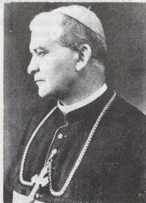
Palaimintasis Jurgis Matulaitis