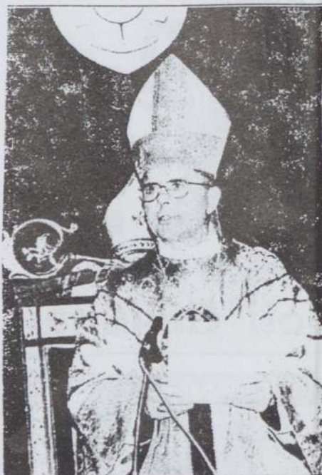
Arkivyskupas Sigitas Tamkevičius

Aktyvių vienuolių ir pasauliečių dėka per šešerius nepriklausomybės metus Lietuvoje plačiai išsiplėtė Caritas veikla. Tačiau dar yra daug parapijų, kur Caritas neveikia, dar daugiau parapijų, kur Caritas veikla suprantama kaip gaunamos labdaros dalijimas. Kunigai į karitatyvinę veiklą dažnai žiūri kaip į nemišią ir jiems nepriklausiančią pareigą. Socialinė veikla Bažnyčioje yra dar neatrasta žemė. Vilčių teikia socialinių studijų centras VDU ir jo ruošiami specialistai. Kunigams reikia visokeriopai remti žmones, dirbančius karitatyvinėje ir socialinėje srityje. Reikia atsikratyti iliuzijų tik moralizavimu kovoti su alkoholizmu ir reikia ieškoti pozityvių būdų stabdyti plintantį alkoholizmą ir narkomaniją. Bažnyčiai reikia palaikyti kiekvieną