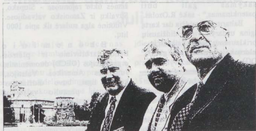
Estijos, Latvijos ir Lietuvos vyriausybės vadovai T. Vahi (kairėje), A. Skelė ir M. Stankevičius Trakuose.