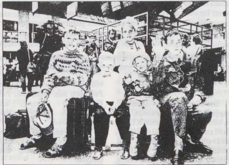
Sunkiai sergantys vaikai prieš kelionę į JAV Vilniaus aerouoste.