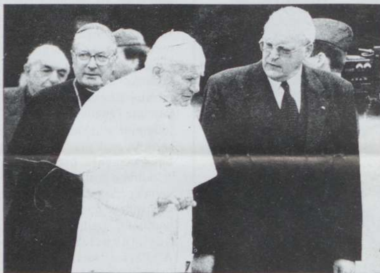
Popiežius Jonas Paulius II su Vokietijos prezidentu R.Herzogu.