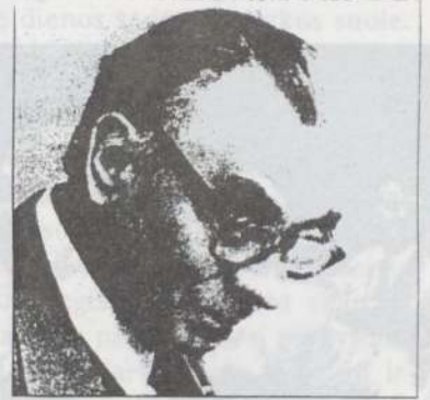
Buvęs LKP vadovas M. Burokevičius.

Sausio 13-osios perversmo byla perduota teismui, kuris gali prasidėti vasaros pabaigoje ir trukti apie pusę metų. Daugiau nei 300 tomų byla perduota Vilniaus apygardos teismui, generalinio prokuroro pavaduotojui Artūriui Paulauskui patvirtinus kaltinamąją išvadą.