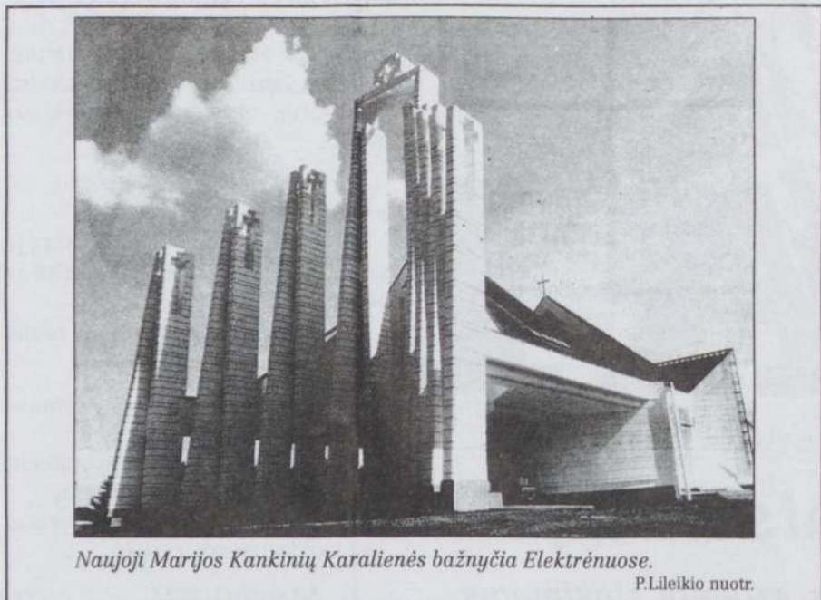
Naujoji Marijos Kankinių Karalienės bažnyčia Elektrėnuose.