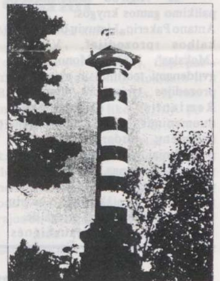
Istorinis Klaipėdos švyturys.

Senasis, Anglijos meistro G.Robinsono dirbtuvėje pagamintas Klaipėdos švyturio aparatas kelią laivams rodė iki 1909 m. Po to jį pakeitė kur kas modernesni prožektoriai su vadinamąja Fresnelio optika. Nuo to laiko kas 4 sekundes skleidžiamus švyturio žybsnius matydavo per 16 jūrmilių nuo kranto nutolę laivai. 1933 m. senasis švyturys ėmė skleisti ir radijo signalus. Antrojo pasaulinio karo pabaigoje jis buvo sugriautas ir