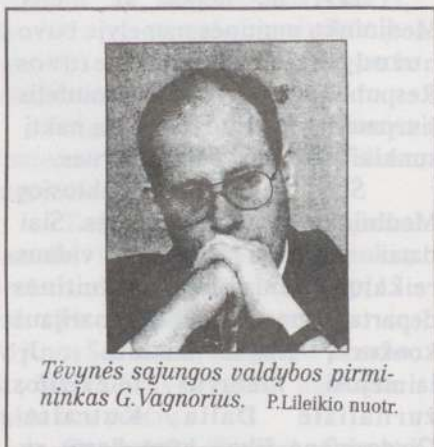
Tėvynės sąjungos valdybos pirmininkas G.Vagnorius.

Vėl įsiliepsnojo karo veiksmai Čečėnijoje ir nematyti ženklų, kad tai būtų laikinas ir praeinantis reiškinys. Prieš Rusijos prezidento rinkimus Maskvoje įvykęs aukščiausio lygio susitikimas tarp prezidento Jelcino ir Čečėnijos vadovo Jandarbijjevo teikė pagrįstą vilčių ir todėl, kad po susitikimo buvo nutraukta ugnis, liovėsi karo veiksmai ir sekė keletas ramių savaičių. Šių dienų naujienų kronikos liudija ką kitą. Kovos siautėja Čečėnijos pietryčiuose. Rusijos karo aviacija bombardavo įvairius kaimus respublikos pietvakariuose. Rusijos žinių laidose kalbama apie Gekio kaimo sulyginimą su žeme Čečėnijoje. Per televiziją rodomi jau daugelį sykių matyti nevilties ir mirties vaizdai: raudančios moterys, bėgančios nuo sumaišties su mažamečiais vaikais ir savo namus nuo federacinių karių ginantys vyrai. Žodžiu, iš naujo įsiliepsnojo karas, jau nusinešęs daugiau kaip 30.000 žmonių gyvybių. Prezidentas Borisas Jelcinas pakartojo nusistatymą, kad Čečėnijos taikos būtina siekti derybomis o ne ginklais. Bet kol kas, rodos, kumščio politika diktuoja viršū imantys generolai.