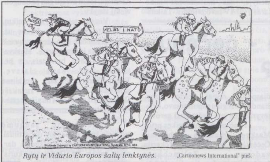
Rytų ir Vidurio Europos šalių lenktynės.