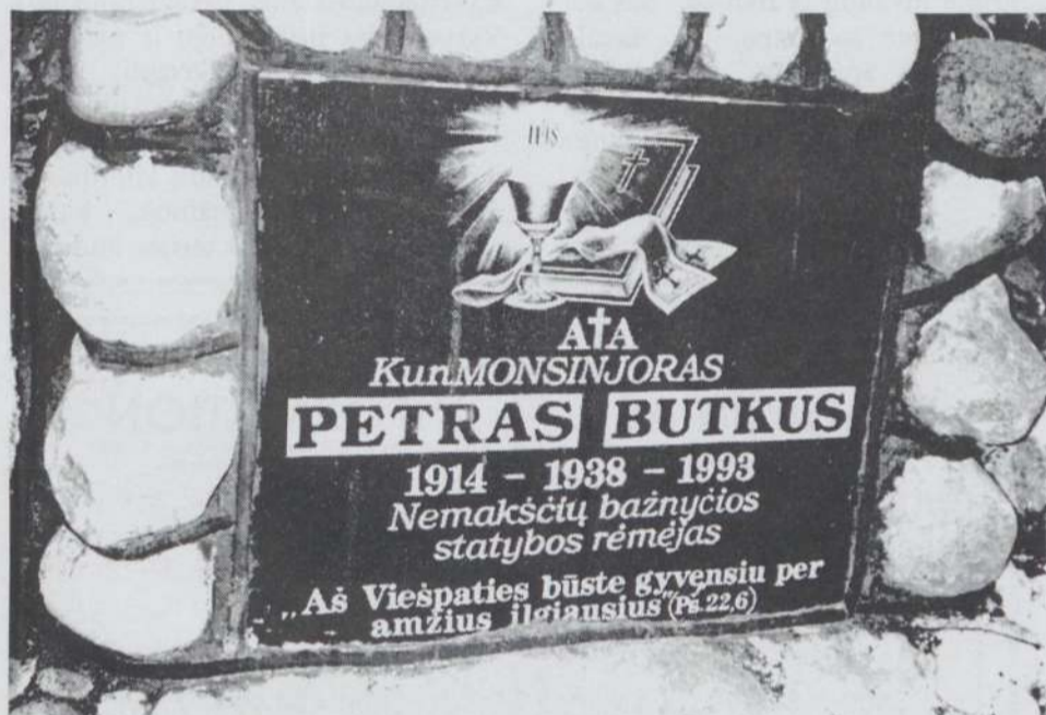
Įrašas ant prel. P. Butkaus paminklo.