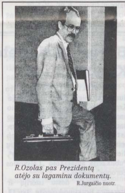
R. Ozolas pas Prezidentą atėjo su lagaminu dokumentų.

„Yra daugybė klausimų, kurie likę už mūsų valdžios institucijų dėmesio lauko“, - sakė R. Ozolas ir pridūrė, kad šiandien pagrindinė jo užduotis yra „rasti tą nesuinteresuotą subjektą, kuris galėtų nešališkai nustatyti Lietuvos žmonių praradimų apimtį ir be politinės spekuliacijos pateikti, kokių būdu atgauti iš jų perimtą