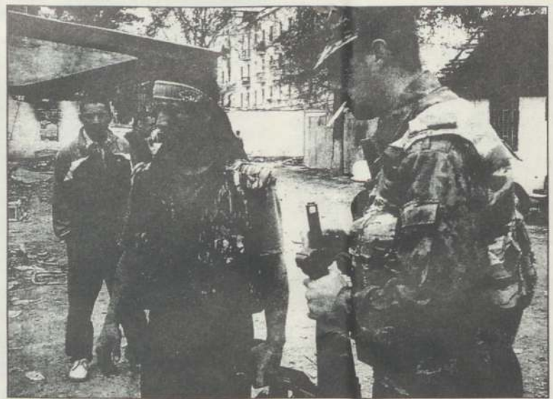
Kol kas rusų ir čečėnų kariai vis dar nešaudo vieni į kitus, o kartu patuliuoja Grozno gatvėse.

Cečėnų sukilėlių karo vadas Aslanas Maschadovas, kalbėdamas Rusijos nepriklausomos televizijos stoties NTV laidoje, pareiškė, kad jo pajėgos gali vėl pradėti kovas, jeigu taikos susitarimas bus nutrauktas. Pasak jo, neaišku, ar taika Čečėnijoje išsilaikys.