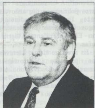
B.Lubys: „Didžiulės užsienio valiutos atsargos leidžia atsisaikyti valiutų valdybos modelio“.