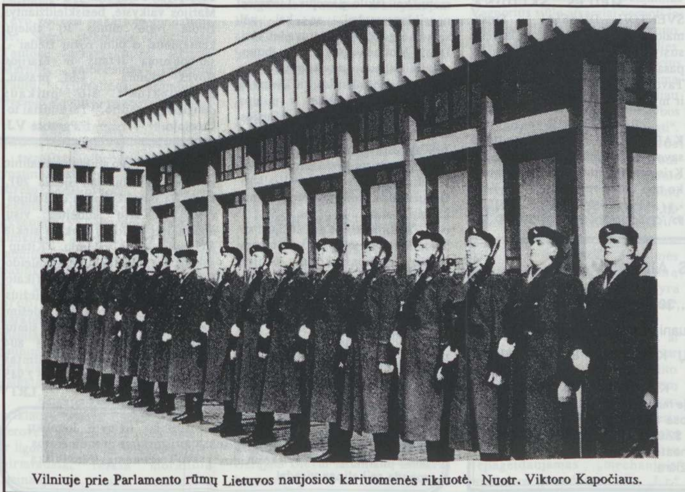
Vilniuje prie Parlamento rūmų Lietuvos naujosios kariuomenės rikiuotė.