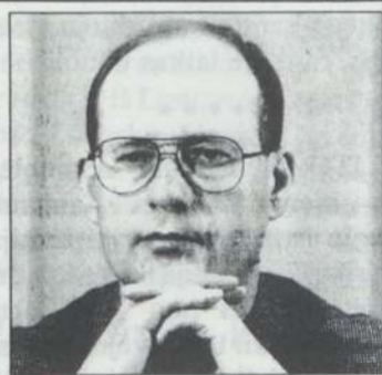
G.Vagnorius siūlo jo žodžius vertinti atsargiai.