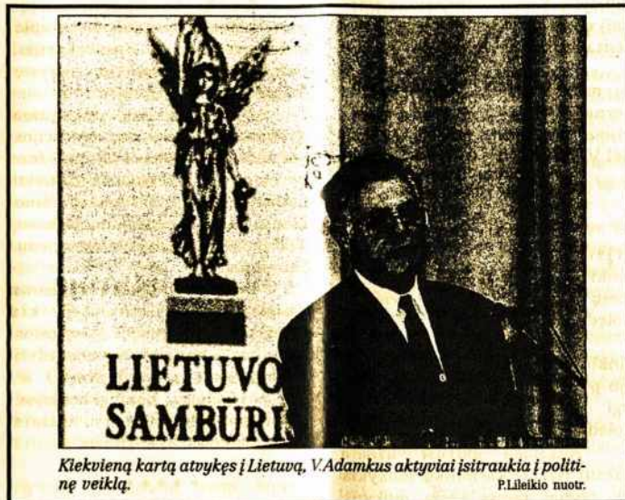
Kiekvieną kartą atvykęs į Lietuvą, V.Adamkus aktyviai įsitraukia į politinę veiklą.

„Dvasiškai niekada nesijaučiau, kad būčiau išvykęs iš Lietuvos. Tai mano tėvynė, aš visuomet būdavau čia bent