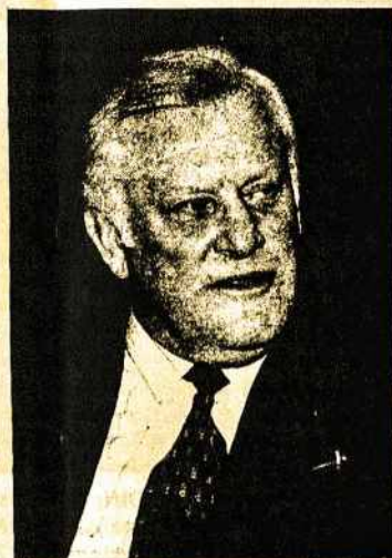
Prezidentas A.Brazauskas jau neteko teisės siūlyti generalinį prokurorą.