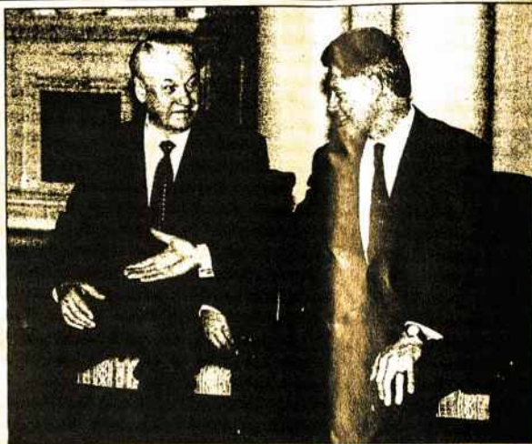
Rusijos prezidentas B.Jelcinas tartis su B.Clintonu dėl NATO plėtros nepanoro.