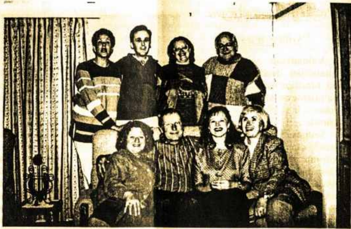
Dirigentų posėdžio metu: