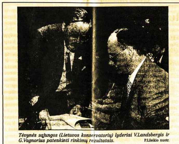
Tėvynės sąjungos (Lietuvos konservatorių) lyderiai V.Landsbergis ir G.Vagnorius patenkinti rinkimų rezultatais.