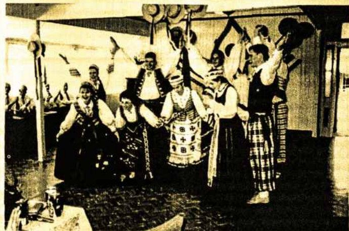
Brisbanė's Lietuvių Tautinių Šokių grupė „Žilvytis“.