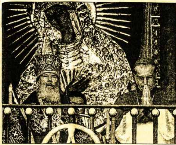
Patriarchas Aleksijus II ir arkivyskupas A.J. Bačkis meldžiasi Aušros Vartų koplyčios balkone.

Neprarasti tikėjimo, meilės, vilties, eiti santarvės ir vienybės keliu palinkėjo Maskvos ir visos Rusijos patriarchas Aleksijus II ir Lietuvos katalikų arkivyskupas metropolitas Audrys Juozas Bačkis, kreipdamiesi į tikinčiuosius iš katalikiškos koplyčios, esančios virš Vilniaus Aušros Vartų.