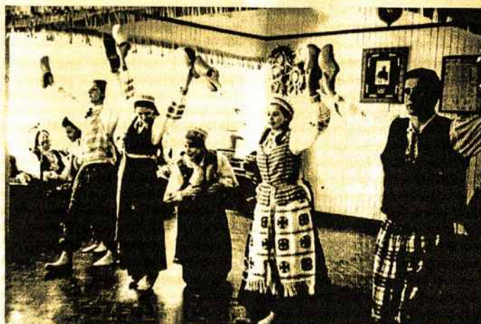
Brisbane's Lietuvių Tautinių šokių grupė „Žilvytis“ šoka „Sokį su Klumpėmis“.

Šeimos šventės, gimtadieniai ar kas panašaus. Kodėl ne Lietuvių Namuose? Kodėl nepasiteirauti? Skambinkite 9708 1414.