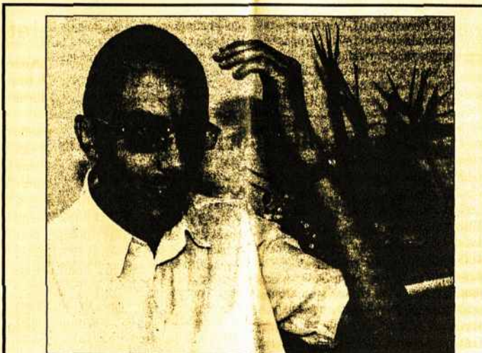
Prancūzijos diplomatas P.Donabedianas: „Dabar jaučiuosi tarsi naujai gimęs“.