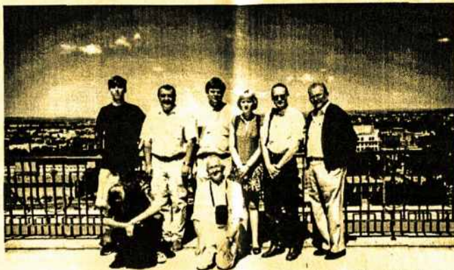
Moksleivių chemikų Tarptautinės Olimpiados dalyviai lietuvičiai su savo vadovais ir monrealiečiais.

Mokausi Vilniaus tikslųjų, gamtos mokslų ir technikos mokslų