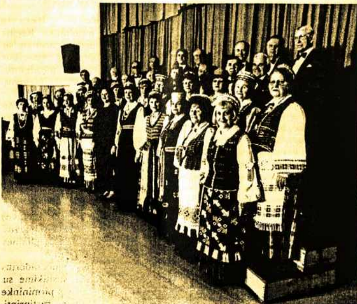
Melbourno "Dainos Sambūris" (Aprašymas 8 psl.)