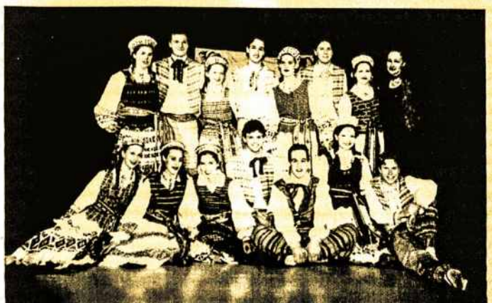
"Gintaras" jaunųjų grupė (Aprašymas 8 psl.)