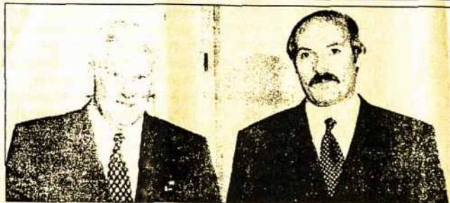
Rusijos premjero V.Černomyrdino (dešinėje) pokalbis su A.Lukašenka Vilniuje turėjo įtakos tam, kad A.Brazauskui nepavyko pasirašyti sutarties su Baltarusijos vadovu.