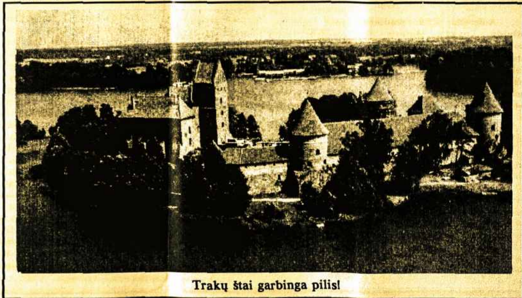
Trakų štai garbinga pilis!