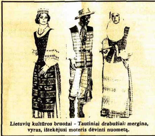
Lietuvių kultūros bruožai - Tautiniai drabužiai: mergina, vyras, ištekejusi moteris dėvinti nuometą.

Nomadai turi didelių užsimojimų ir gabumų didelėms valstybėms kurti. Iš nomadinių tautų yra išaugusios visuomeninės ir teisinės institucijos. Nomadai yra buvę kodeksų, luomų, parlamentų kūrėjai. Ryšium su tuo minėtinas ir