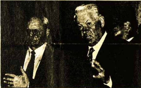
B. Jelcinas (dešinėje) ir R. Herzogas po derybų kalbėjosi su žurnalistais.

Rusijos prezidentas Borisas Jelcinas Maskvoje susitiko su Vokietijos prezidentu Romanu Herzogu.