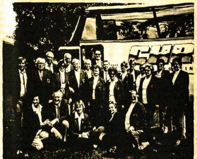
Melbourno Dainos „Sambūris“ Wodongoje prie visur vežiojusio autobuso.

Dienos koncertą užbaigė jungtiniu choru. Australijos kariniam orkestrui pritariant,