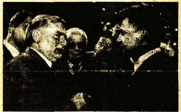
Buvęs „Solidarnosc“ lyderis L. Wałęsa sveikina su pergale dabartinį jos vadovą M. Krzaklewskį (dešinėje).

Valstybinė rinkimų komisija paskelbė mandatų pasiskirstymą Seime. Pirmą kartą rinkimuose dalyvavusi Lenkijos rinkimų akcija „Solidarnosc“ (RAS) iš 460 vietų iškovojo 201 mandatą ir tapo stipriausia jėga parlamente.