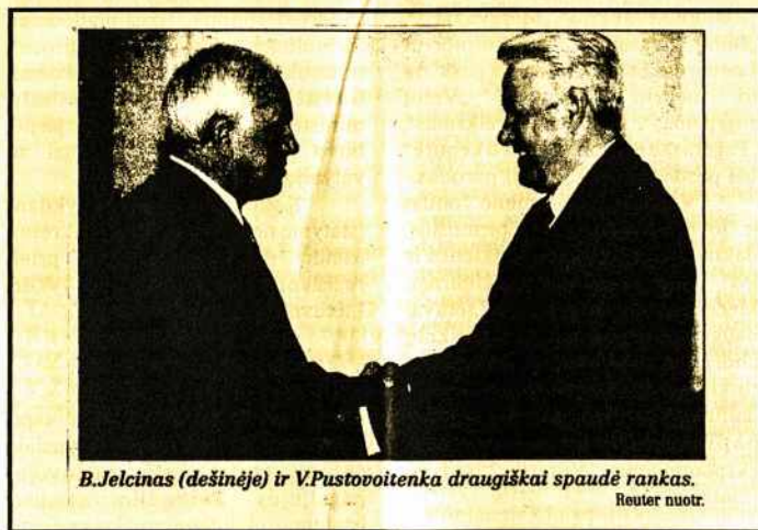
B.Jelcinas (dešinėje) ir V.Pustovoitenka draugiškai spaudė rankas.

„Tai kenkia Rusijos ekonomikai, - pareiškė V.Cernomyrdinas. - Manau, kad Ukrainos ekonomika dėl to taip pat pralaimi“.