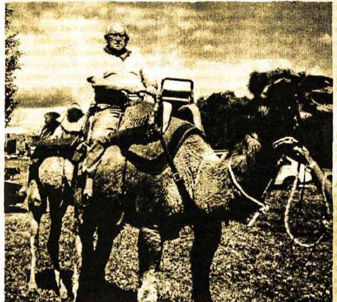
Buvo ten ir „Loransas iš Arabijos“ (J.Vaitkus)