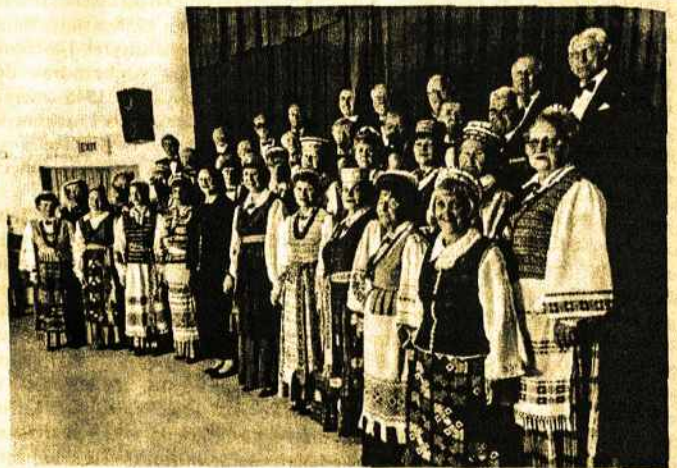
Melburno Lietuvių Dainos „Sambūris“ koncertuos Lietuvių Namuose gruodžio 7d.

Nepajutome, per gyvenimo tėkmę bebėgdami Dainos Sambūrio choristai, kad reikia ruošti 48-jam metiniam koncertui.