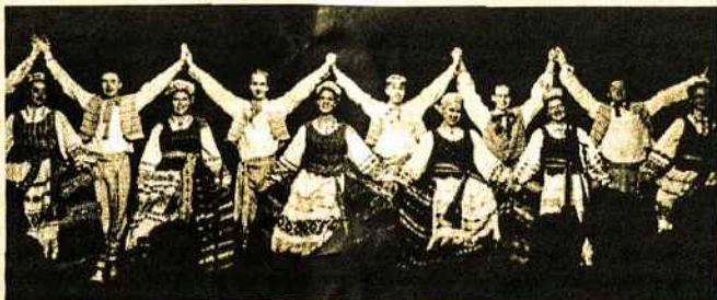
Tautinių šokių „Gintaras“ jaunesnioji studentų grupė „Bonegilla 97“ Festivalyje