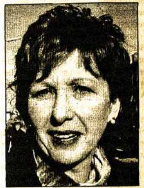
Naujoji Airijos Respublikos prezidentė M. McAleese.

Teisės profesorė Mary McAleese, laimėjusi Airijos prezidento rinkimus, tuoj pat pareiškė draugiškumą Londono valdžios šiaurės Airijoje šalininkams ir pažadėjo „airių amžiaus“ pradžią.