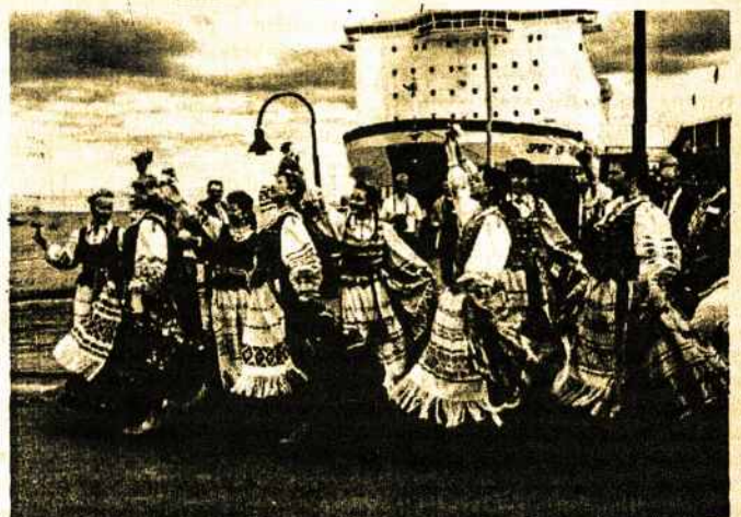
Tautinių šokių grupės „Gintaras“ mergaitės šoka Station Pier minėjime.

4. Sveikiname ir dėkojame visiems sporto korespondentams kurie rašė ir rašo į mūsų laikraščius lietuvių ir anglų kalbomis. Prašome nesustoti rašyti toliau. K.Starinskas