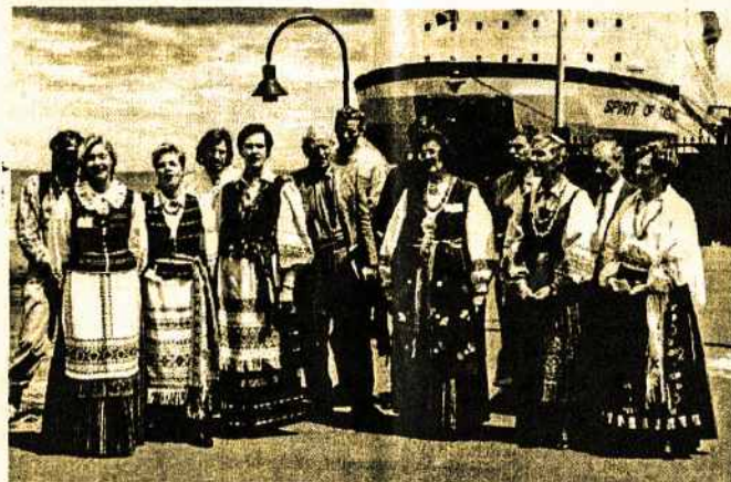
Melburno „Kaimo Dainininkai“.