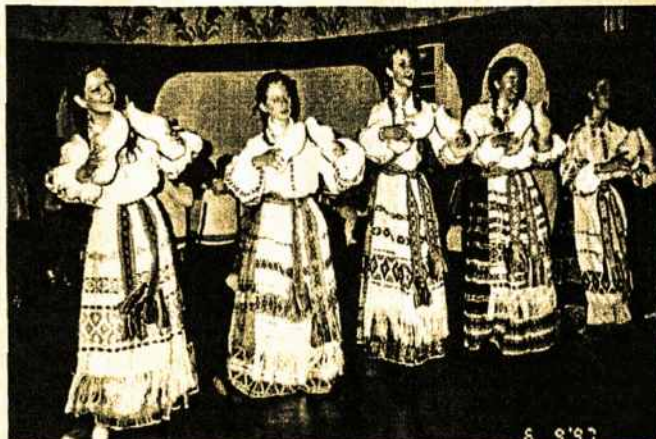
Sokių grupės „Gintaras“ mergaitės su klumpėmis.

Dienos dar ilgėja, tačiau rūpesčių, darbų ir darbelių virtinė sparčiai didėja, o, deja, laikas iki taip greitai atsukanciu Kalėdų švenčių - nepastebėtinai tirpsta ir trumpėja. Nors su metų galu yra susijusios egzaminų sesijos mūsų studentijai, „Gintaro“ tautinių sokių grupės jaunimas spėja aktyviai reikštis mūsų lietuviškos bendruomenės gyvenime.