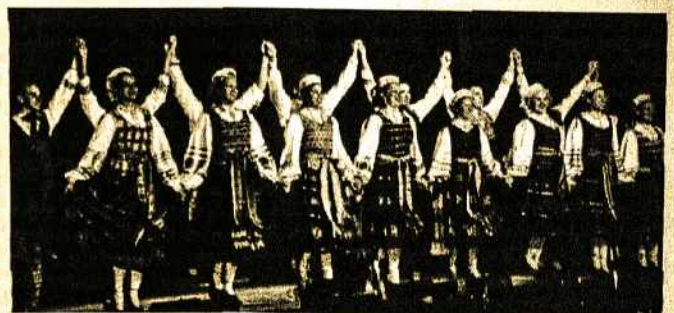
Gintaro vyresnioji studentų grupė

Seimos šventės, gimtadieniai ar kas panašaus. Kodėl ne Lietuvių Namuose? Kodėl nepasiteirauti? Skambinkite 9708 1414.