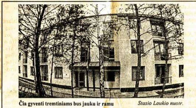
Čia gyventi tremtiniais bus jauku ir ramu