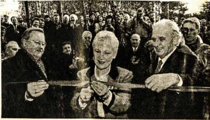
Tremtinių globos namų juostelė perkirpo Seimo pirmininkas V.Landsbergis, socialinės apsaugos ir darbo ministrė I.Degutienė ir Tremtinių grįžimo fondo valdybos pirmininkas V.Cinauskas