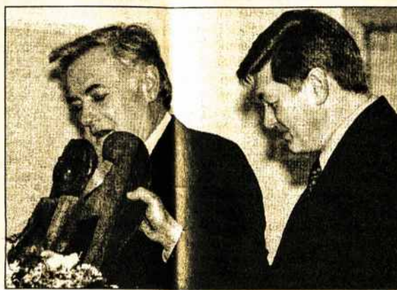
Išrinktąjį Prezidentą V.Adamkų pasveikino ir padovanojo skulptūrą „Laisvė“ buvęs jo varžovas A.Paulauskas.

1952-ųjų viduryje V.Adamkus su žmona grįžo gyventi į Čikagą ir pradėjo studijuoti inžineriją prestižiniame Iliojaus technologijos institute.