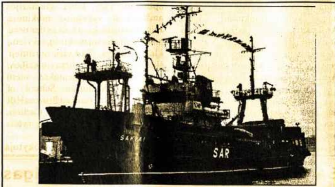
Tokio modernaus gelbėjimo laivo kol kas neturi kaimyninės Baltijos valstybės.