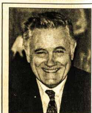
V. Adamkus Amerikoje kalbasi su žurnalistais ir tvarko savo asmeninius reikalus.

Vėliau V. Adamkus ir jo žmona Alma Adamkienė ketina susitikti su Čikagos lietuvių bendruomenės atstovais. Daugelis šios bendruomenės narių palaikė jį per Lietuvos Prezidento rinkimus.