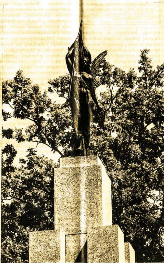
Laisvės statula (skulptorius J. Zikaras)

Sventosios Lietuvos žemė kuri yra aplaistyta brolių artųjų prakaitų, motinų ašaromis ir laisvės kovotojų krauju, papuošta