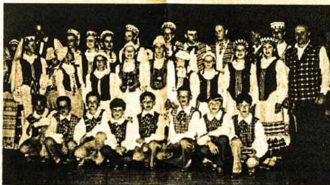
Tautinių šokių grupė iš Lietuvos „Pynimėlis“ ir Melbourne „Gintaras“.

Po to pasirodė mišrus choras su dviem gražiai padainuotom (Nukelta į 6-tą psl.)