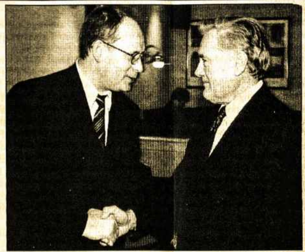
Ar pavyks V. Adamkui įtikinti G. Vagnorių, jog ministrų kabinetą reikėtų stipriai pertvarkyti?