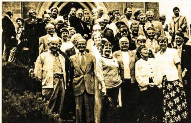
Prie šv. Marijos katedros, Hobart, 24 sausio, 1998 - Tasmanijos lietuviai, draugai, Vilties ir Universal Voice choristai

Iškilmės tęsėsi tą pačią dieną Tasmanijos parlamento rūmuose, kur opozicijos vadovas Jim Bacon su padėjėjais sveikino apie pusantro šimto pabaltiečių 50 m. sukakties progą. Pažymėjo, kad pabaltiečių ir kitų imigrantų dėka buvo po karo išplėsta Tasmanijos pramonė.