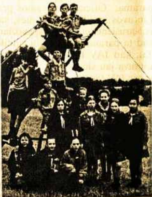
"Džiugo" Tunto "Miško Brolių" stovykla – užbaigus vėliavos bokšto statymą