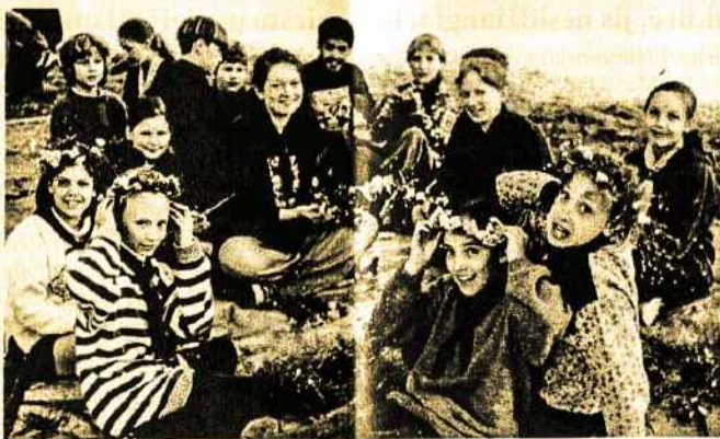
"Džiugo" Tunto "Miško Brolių" stovykla. Sesės pina Joninių vainikus

veikiat?" – klausia neskautai. "O daug ką – štai keletas pavyzdžių": Pionerijos užsiėmimai – dviejų vėliavų bokštų statyba iš karčių ir virvių; religine tema piešiniai; paskaitos apie partizanų kovas ir jų kančias; dainų mokymas; paskaita kaip elgtis sunkiose sąlygose gantoje; sporto varžybos: šachmatų varžybos; morzės ir semaforų signalizavimo mokymas; lietuvių kalbos pamokos; kaip naudotis kompasu ir žemėlapių; ilgą dieną iškyklą; naktiniai skautiški žaidimai gamtoje; pirmos pagalbos suteikimo mokymai.