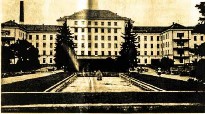
Kauno Akademinė klinika