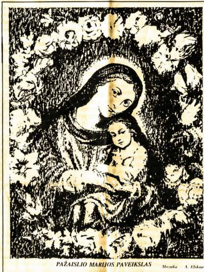
PAŽAISLIO MARIJOS PAVEIKSLAS Muzika A. Elksaus

Ne per daug mielo mokslo, bet užtai malonių užsiėmimų kaleidoskopas sukosi ir sukosi... kol visa savo esme tu pajutai, kad esi mergaitė, ir graži mergaitė. Ir žaidimo, jau visai rimto žaidimo pagunda užvaldė tave. Tik dabar tu žaidei jau ne su lėlėmis. Tau parūpo tavo išvaizda, laikysena, elgsena. Tau tapo be galo svarbu, kokia tu esi jų akyse, o vėliau: to šauniausiojo, gražiausiojo akyse. O kiek svajonių, kankinančio laukimo bei nerimo, net ašarų ar netikėto džiaugsmo patyrei tuomet, kai širdis ruošėsi ir brėndė meilei. Tu troškai dalintis, pažinti, mylėti. Jau nebeužteko šeimos židinio šilumos ir motinos meilės. Viduje kažkas nerimo ir traukė į aplinkinį pasaulį. Nauji atradimai, patirtys, išgyvenimai kūrė tavyje naują pasaulį. Jis veržė veržėsi atsiverti kitam ir tuo pačiu troškai pamatyti kito pasaulį. Gal tai buvo draugė, su kuria pasikeitė amžinos meilės priesaika, gal tai buvo pirmoji meilė ir tokia pat "amžina" kaip tarp draugės ir tavęs. Taip tu įžengei į meilės pasaulį.