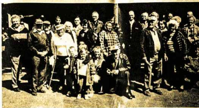
Pabaltiečių gegužinėje š.m. kovo 4d. Tolosa Parke, Glenorchy (Hobart) Tasmanija.

Po sėkmingo 50 metų jubilėjaus atšventimo sausio mėnesį, pagalvojom kad būtų gerai Hobarto pabaltiečiams vėl susirinkti ir padraugauti. Taip padarėme šeštadienį, 15 kovo, Tolosa Parke. Susirinko apie 40 pabaltiečių, pavalgė kepsnius, išgėrė truputį, pasikalbėjo pasiklausė muzikos.