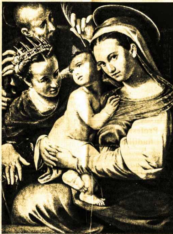
Šventoji šeima su šventąja Kotryna iš Aleksandrijos. (Manoma, kad ji piešė Prospero Fontana)

Dievas nereikalauja, kad žmogus statytų jam rūmus. Jis leidžia pačiam žmogui statyti namus, kurti šeimos židinį, kurio liepsna yra pati didžiausia Dievo suteikta dovana – vaisingumas,