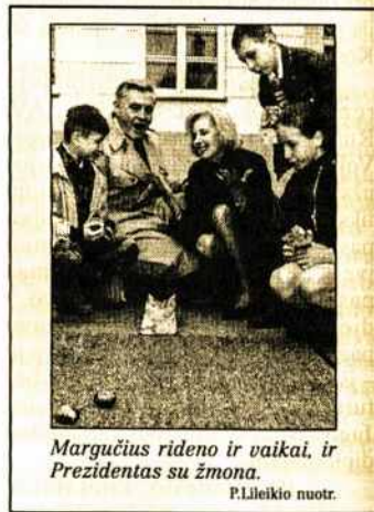
Margučius rideno ir vaikai, ir Prezidentas su žmona.

Susikibę už rankų, rateliuose sukosi ir V. Adamkus, ir A. Adamkienė. Pašokti su vaikais norėjo ir Seimo narė Vilija Aleknaite-Abramkienė, tačiau bendrauti su svetimais vengė