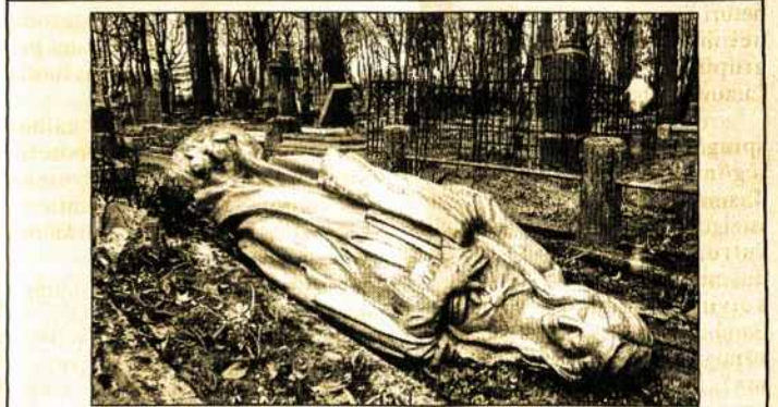
Vandalų nuniokotos senosios Panevėžio kapinės.

Balandžio 16-tos rytą pastebėta, kad išniekintos senosios Panevėžio kapinės, esančios Sporto gatvėje. Į kapines iškviešti Panevėžio policijos pareigūnai suskaičiavo, kad išniekinti 36 kapai. Suniokota 30 paminklų, išrauti ir numesti keturi kryžiai, parverstos dvi Marijos statulėlės. Bandyta nuverstti ir didelę Kristaus statulą.