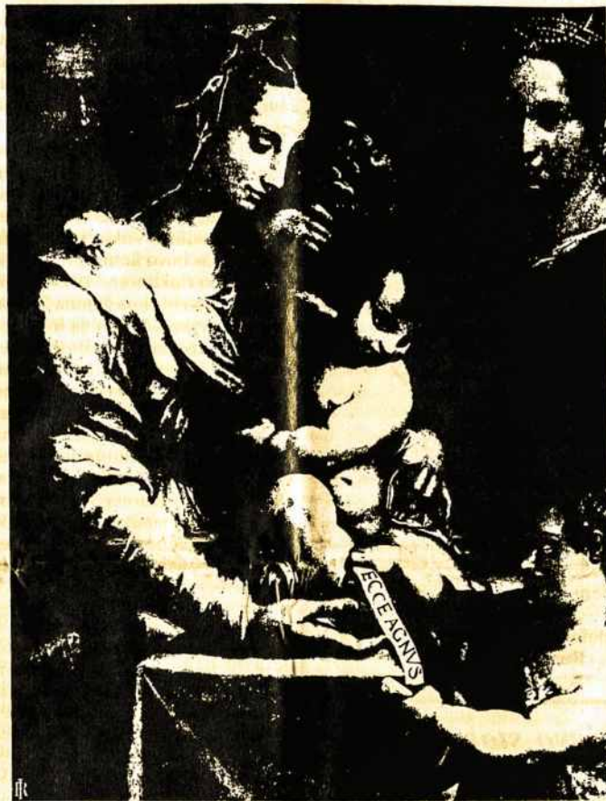
Šventoji Šeima su berniuku, vėliau tapusiu šv. Jono krikštytoju Paveikslą piešė Prospero Fontana.

Yra viena labai svarbi problema: žmogus, kuriam atrodo,