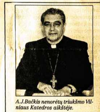
A.J. Bačkis nenorėtų triukšmo Vilniaus Katedros aikštėje.

Arkivyskupas pasidžiaugė savivaldybės ketinimu apšviesti gražiausias Vilniaus bažnyčias, tačiau nepritarė siūlymui veikiančiuose maldos namuose rengti daugiau kultūrinių renginių, laikyti juos atvirus turistams visą dieną.