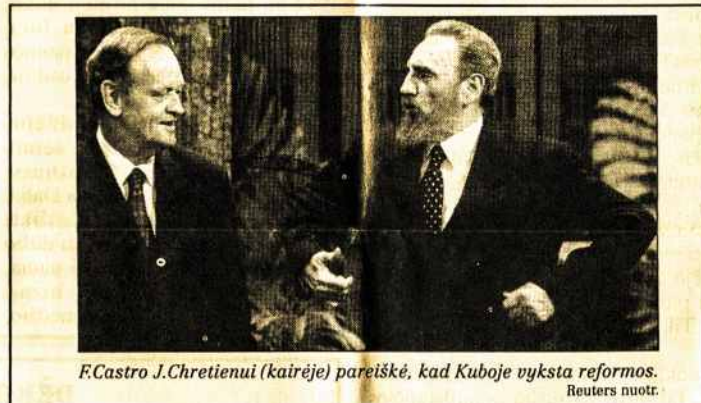
F.Castro J.Chretieniui (kairėje) pareiškė, kad Kuboje vyksta reformos.

Balandžio 28 d. baigėsi Kanados premjero Jeano Chretienio oficialus vizitas Kuboje. JAV bandant spausti Havaną, Kanada pabrėžė, kad nori taikiai šalinti nesutarimus.