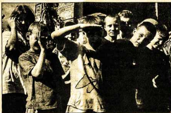
Vilniaus laikinosios globos namų „Atsigrėžk“ auklėtiniai šiuo metu išlaikomi iš labdaros.

V.Lamanuskas sakė, kad greičiausiai bus atsisakyta tų programų, kuriose Valstybės kontrolė surado finansinių pažeidimų: minėtų „Atsigrėžk“,