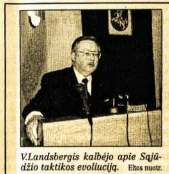
V.Landsbergis kalbėjo apie Sąjūdžio taktikos evoliuciją.

Lietuvos istorijos institute įvyko Sąjūdžio 10-mečiui skirta dviejų dienų mokslinė konferencija “Lietuvos Sąjūdis ir valstybės atkūrimo idealų įgyvendinimas”.