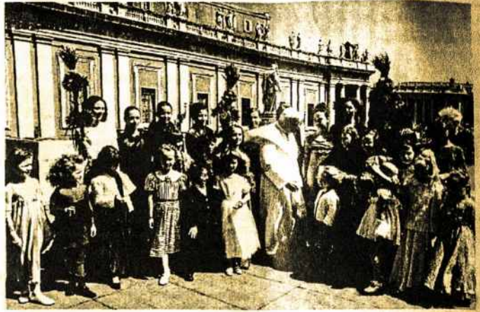
Mažieji Lietuvos modeliai svečiuose pas Popiežių Joną Paulių II