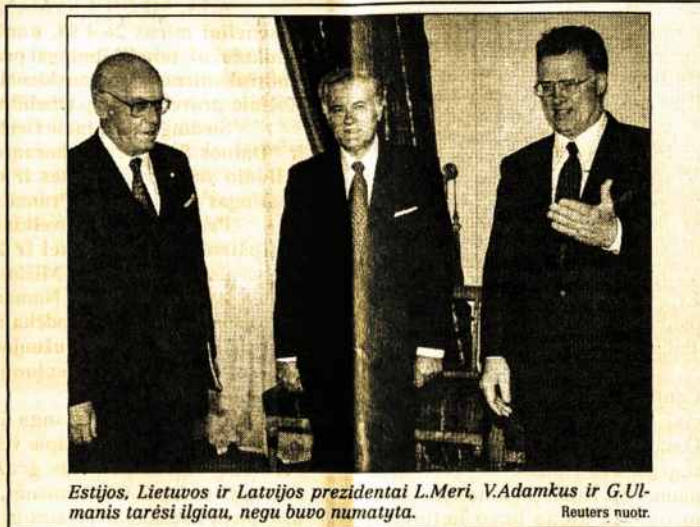
Estijos, Lietuvos ir Latvijos prezidentai L.Meri, V.Adamkus ir G.Ulmanis tarėsi ilgiau, negu buvo numatyta.

Prezidentai sveikino sklandų naujų narių priėmimo į NATO dokumentų ratifikavimo procesą ir