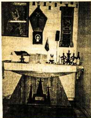
Švč. Marijos Aušros Vartų kopytėlės altorius Lietuvių Parapijos Namuose, Kensingtone.

Melburno Lietuvių Katalikų Moterų Draugija