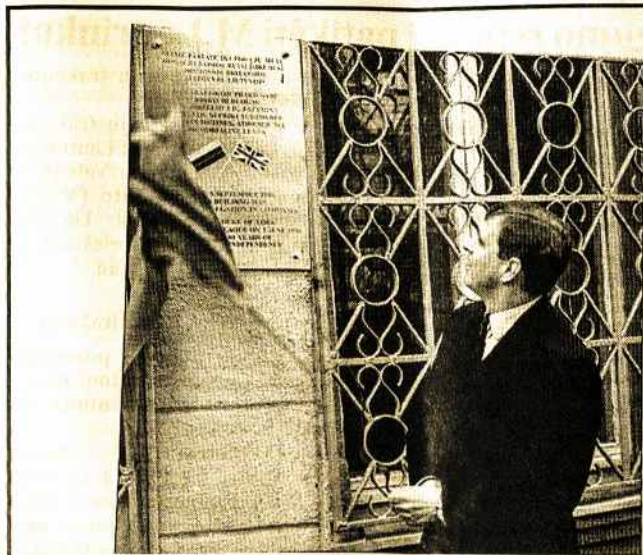
Jorko hercogas atidengė lentą ant tarpukario metais Kaune veikusios Didžiosios Britanijos atstovybės pastato.