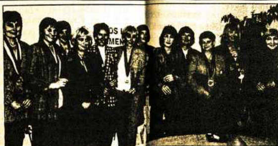
"Kamanės" klubo krepšininkės – pasaulio veteranų žaidynių nugalėtojos.

Daugiausia rėmėjų ir savo lėšomis nuskrudusios į Portlendą, Lietuvos krepšinininkės pačios