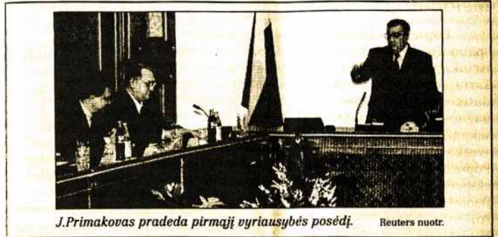
J.Primakovas pradeda pirmąjį vyriausybės posėdį.