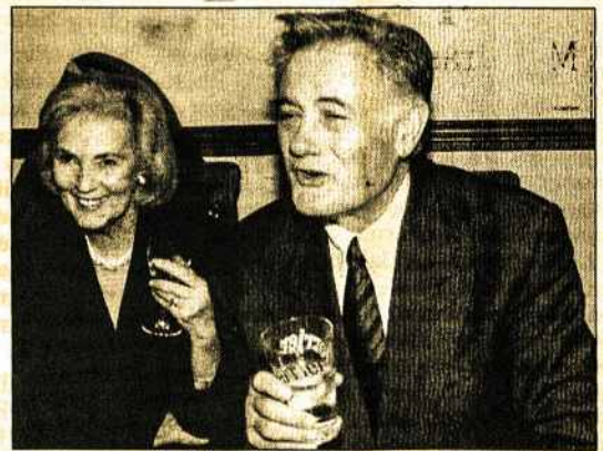
V.Adamkus tik vakare savo gimtadienį galėjo atšvęsti su žmona Alma.