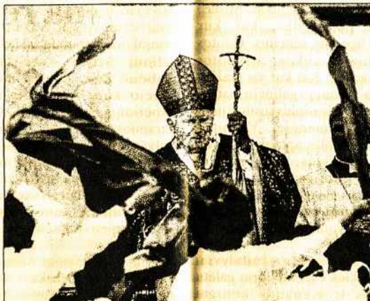
Visą savaitgalį Sr. Petro aikštėje šurmuliavo minia, sveikinti Joną Paulių II.

"Fides et ratio" pateikia išsamią krikščionybės ir filosofijos, tikėjimo ir žmogaus pažinimo