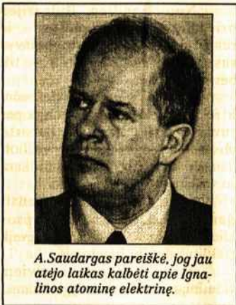
A.Saudargas pareiškė, jog jau atėjo laikas kalbėti apie Ignalinos atominę elektrinę.

Tai pirmąkart pripažino Lietuvos užsienio reikalų ministras