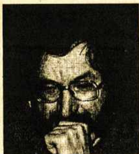
S.Geda – Baltijos Asamblėjos premijos laureatas