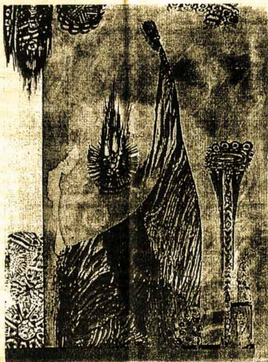
LIETUVA, "TU MAŽYTĖ, TU TELPI VISA Į ČIURLIONIO KARALIŲ DELNUS". Dail. Genė Valiūnienė