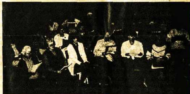
XX-ajai ALD šventei ruošiantis Adelaidės “Lituania” choro repeticija. Adelaide 1998 rugp. mėn.