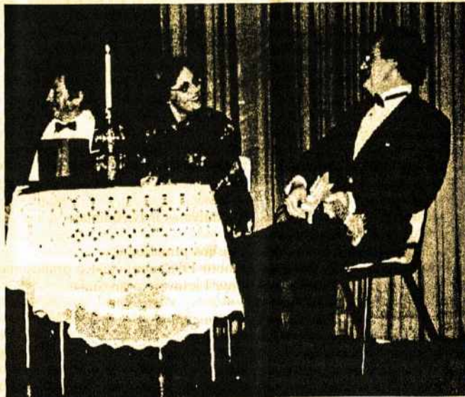
"Vakaras Naktiniam Klube"

Reikia pasakyti, kad abi dainos pasigėrėtina gerai buvo atiktos Sambūrio per šį koncertą Melbourne, ypatingai paskutinėje dainoje, choristai pagauti praieities įkvėpimo, pasiekė puikų rezultatą.