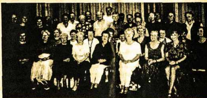
XX-ajai ALD šventei ruošiantis Sydnėjaus choro “Daina” repeticija. Choristai linksmi, nes viską moka mintinai. 1998 lapkr. mėn.