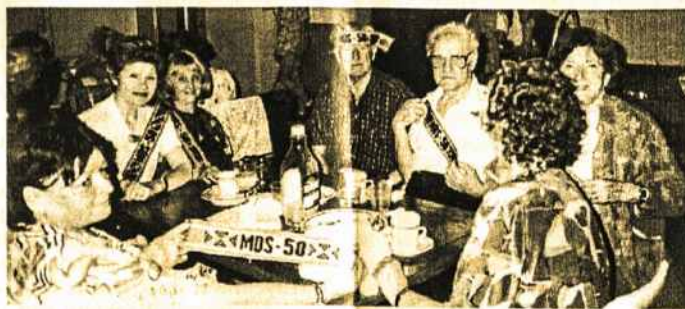
Mokame dainuoti, bet mokame ir linksintis bei su jumoru tarpusavy bendrauti.

Melbourn Dainos Sambūris dar yra gavęs pasveikinimą iš Lietuvos. Jį atsiuntė Vilniaus Arkikatedros didysis choras ir jo vadovas L.Pranulis.