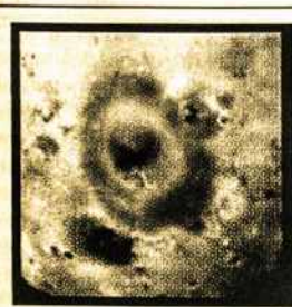
„Galileo“ nuotraukoje - lava, besiveržianti iš ugnikalnio.

Vieno iš Jupiterio palydavo Ijo neseniai padarytos vulkanų ir lavos nuotraukos gali padėti mokslininkams atskleisti daugiau žinių apie Žemę prieš milijardus metų buvusiu vulkaniniu laikotarpiu. JAV Nacionalinės aeronautikos ir kosmoso