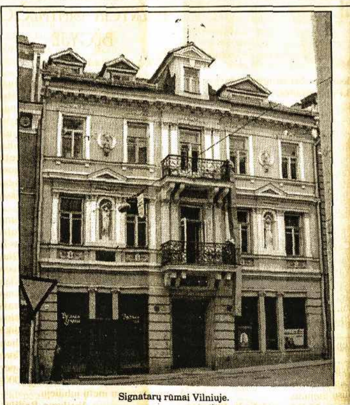
Signatarų rūmai Vilniuje.