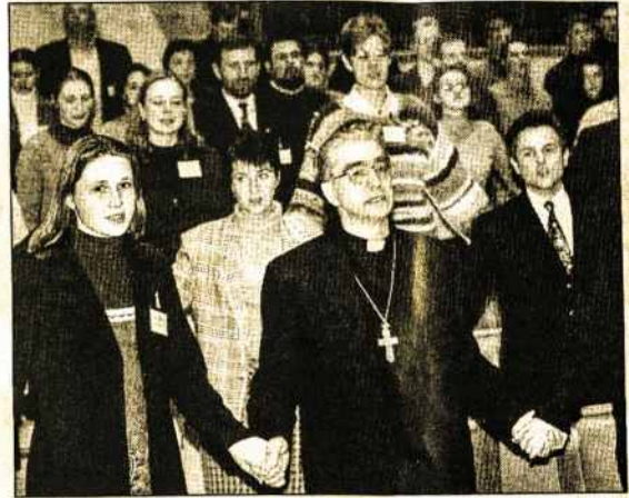
Politikų ir jaunimo maldai Seimo posėdžių salėje vadovavo Vilniaus arkivyskupas metropolitas A.J.Bačkis.