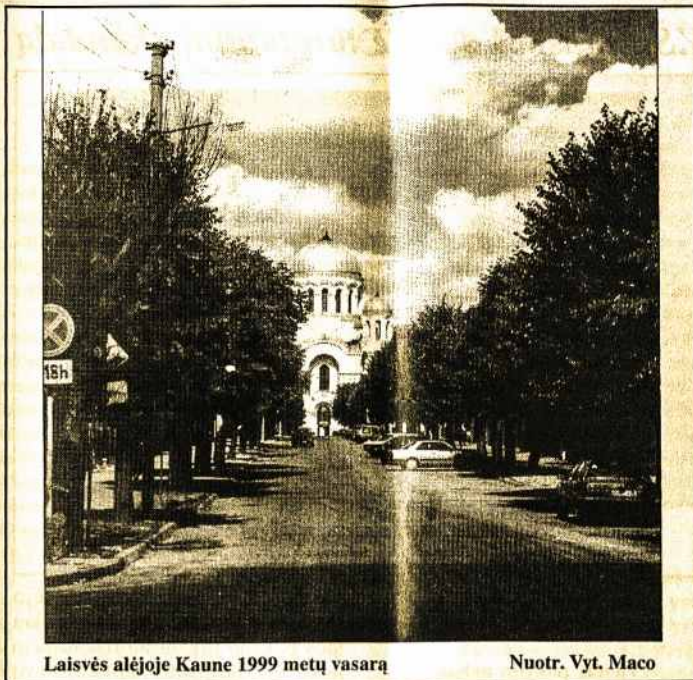
Laisvės alėjoje Kaune 1999 metų vasarą