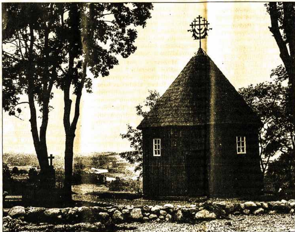
ISTORINĖS KERNAVĖS VAIZDAS, kuriame matyti kapinės, piliakalniai, Neris. Senovės Lietuvoje Kernavė buvo valdovų centras, tarnavęs ir krašto gynybai. Kai kurie istorikai mano, kad tai buvusi Mindaugo pilis Voruta