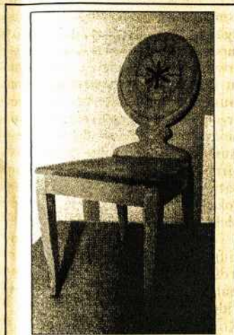
J.Prapuolenio sukurtą kėdę iš svetainės baldų komplekto, 1937 metais Paryžiuje pelniusio aukso medalį.

pagrindė jau 1956 metais, tačiau meistras atsisakė tik pedagoginio darbo ir vėl pasinėrė į kūrybą.