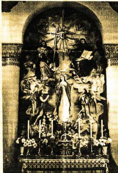
LIETUVIŲ ŠV. KAZIMIERO BAŽNYČIOS MEDŽIO DROŽINIŲ ALTORIUS LONDONE ANGLIJOJ

nusibodę, o labiausiai - nelaukime padėkos, išgarsinimo, kad mus, kad mane imtų girti už menką darbą, už pastangas, už atliką kasdienę pareigą. Mokyk mane, kuklusis ir išmintingasis Išganytoju, nesidrovėti užsukti pas nepažįstamą, užkalbinti praėivį, ypač jeigu jis ko nors stokoja, nebijoti aplankyti ligonio, nešykštėti sušelpsti skurdžiaus, užtarti neteisingai apkaltintą, išdrįsti atsiprašyti įžeistą. Mokyk mane eiti kitur, kur tik žmogus stokoja šviesos, gerumo, tiesos, ypač šilumos, kurios taip pasiilgęs kiekvienas skausmo ragavęs žmogus.