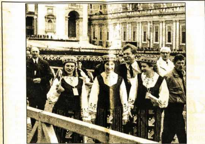
Maldininkės iš Lietuvos Vatikane.