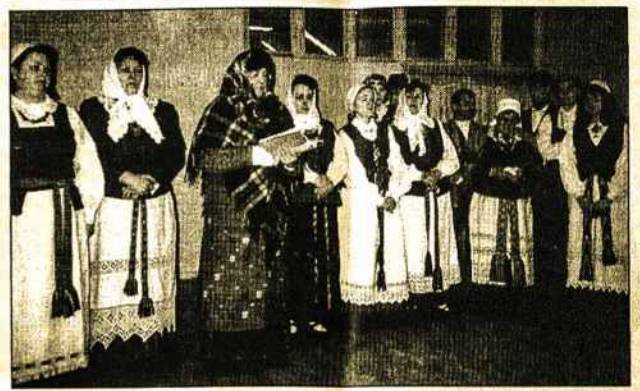
Kaišiadorių folklorinis sambūris "Verpetas", atlikęs programą politikalinių bei tremtinių renginyje

Pačioje 2000-ųjų metų pradžioje Kaišiadoryse duris atvėrė naujai rekonstruotas Sielovados centras.