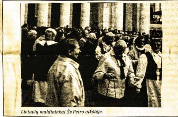
Lietuvių maldininkai Šv.Petro aikštėje.

"Jūs atsivežkite radijo imtuvą, o kitkuo pasirūpinsime mes" - tokį