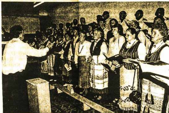
Šv. Mišių metu gieda LPKTS Klaipėdos skyriaus mišrus choras "Atminties gaida"

Ar atvykusiems bus suteiktas (Nukelta į 6-tą psl.)