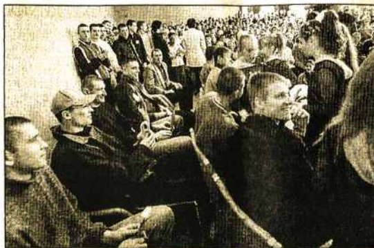
Kauno „Žalgirio“ krepšininkams teko atlaikyti moksleivių klausimų laviną.