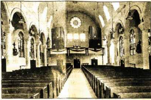
Visų 670 sėdimųjų vietų Šv. Antano bažnyčioje lietuviai katalikai neužima.