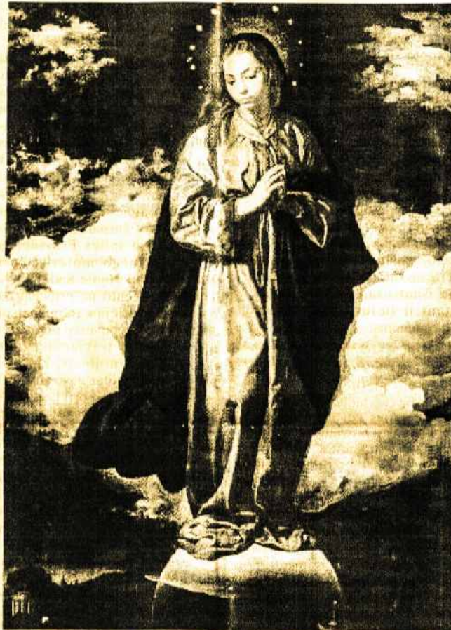
DANGAUS KARALIENĖ dail. Velazquez

skelbia "Uolų troškimą mokytiš mums kelia pirmiausia mokytojo kilnumas. O kas gali būti kilniau už Dievo Motiną? Kas spindi labiau už tą, kurią išrinko pats Spindėjimas?" Marija gyvena ir igyvendina savo laisvę, atsiduodama Dievui ir priimdama savin Dievo dovaną. Ji saugo savo mergiškose įsėiose žmogumi tapusį Dievo Sūnų iki jo gimimo, auklėja, augina ir lydi jį aukščiausiam laisvės judesyje, kuris yra visiškai savo gyvybės paaukojimas. Atiduodama save, Marija visiškai įsitraukia į pasauliui atiduodančio save Dievo sumanymą. Dėmėdamasi ir svarstydama savo širdyje ne visada jai suprantamus įvykius (plg. Lk 2, 19), ji tampa pavyzdžiu visiems, kurie "klausosi Dievo žodžio ir jo laikosi" (Lk 11, 28), ir nusipelno "Išminties sosto" titulo. Ta Išmintis yra pats Jėzus Kristus, amžinasis Dievo Žodis, apreiškiantis ir tobulai įvykdantis Tėvo valią (plg. Jn 10, 5-10). Marija kviečia kiekvieną žmogų priimti šią Išmintį. Tai mums ji skiria nurodymą, kurį per vestuves Galilėjos Kanoje davė tarnams: "Darykite, ką tik jis jums lieps".