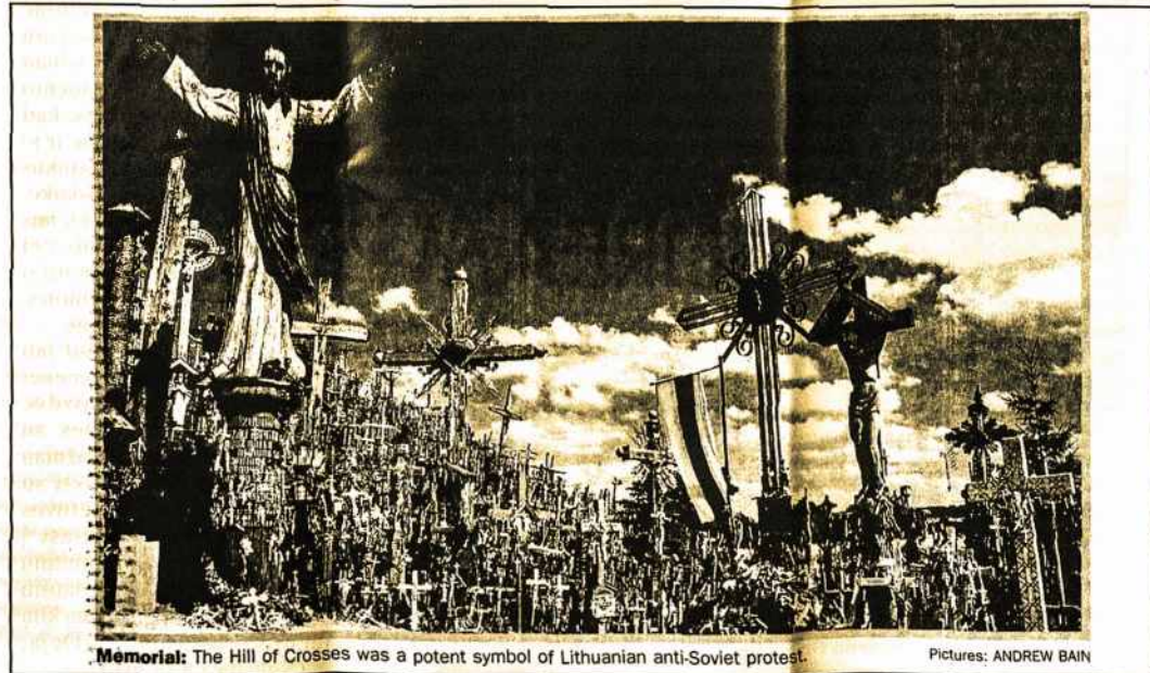
Memorial: The Hill of Crosses was a potent symbol of Lithuanian anti-Soviet protest.

Š.m. balandžio mėn. 8 d., šeštadienį, Melbourno dienraščiui "The Age" savo kelionių skyriuje per visą puslapį įsidėjo platų ir išsamų straipsnį apie Lietuvą. Žurnalistas Andrew Bain stebisi lietuvių tautos dvasios tiesiog stebuklingu atsparumu ir užsispyrimu, atstatant Sovietų nualintą ir suniokotą kraštą. Jis žvelgia per istorijos bėgį, pažymėdamas, kad Lietuvos vardas jau buvo minimas XI-tam šimtmečiuje. Šimtmečių bėgyje lietuviai sukūrė imperiją nuo Baltijos iki Juodųjų jūrų. Vėliau, nusilpus