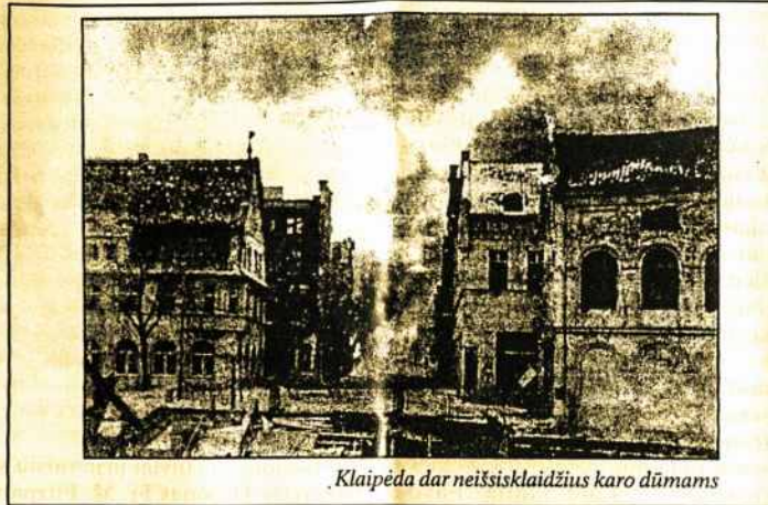
Klaipėda dar neišsiklaidžius karo dūmams