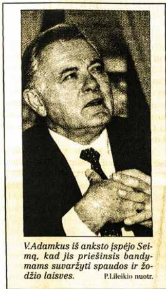
V. Adamkus iš anksto įspėjo Seimą, kad jis priešinsis bandymams suvaržyti spaudos ir žodžio laisvę.