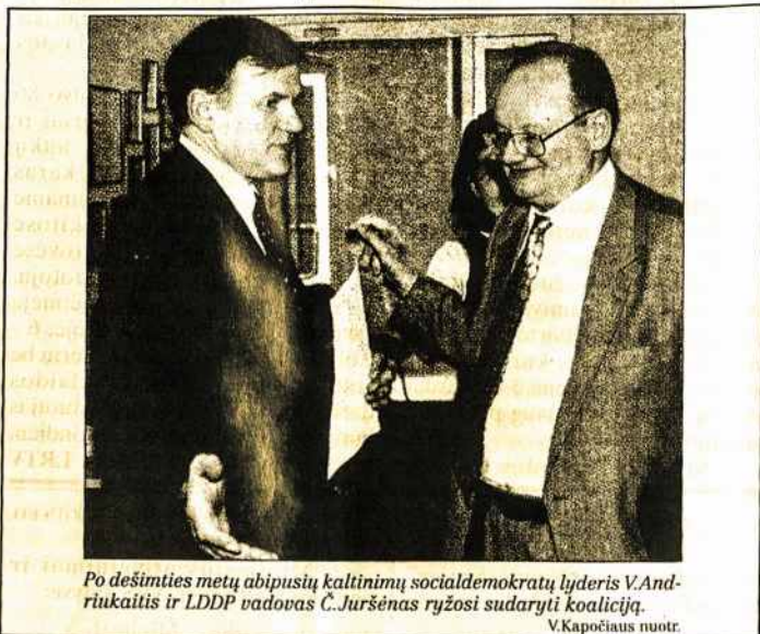
Po dešimties metų abipusių kaltinimų socialdemokratų lyderis V. Andriukaitis ir LDDP vadovas C. Juršėnas ryžosi sudaryti koaliciją.

Balandžio 28 d. posėdžiavusios Demokratinės darbo partijos (LDDP) ir Socialdemokratų partijos (LSDP) tarybos nutarė sudaryti rinkimų koaliciją, bendrą rinkimų štabą, tačiau, kaip teigė LDDP lyderis Česlovas Juršėnas, iki abiejų partijų susijungimo turės būti žengtas "ne vienas žingsnis, nes tai yra pernelyg rimtas dalykas ir mūsų partijoms".