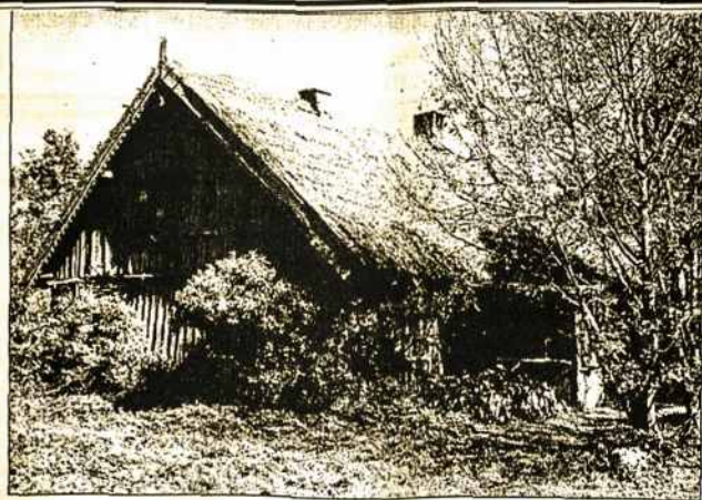
Klaipėdos krašto Rūgulių kaimo troba, praeityje puošta mediniais drožiniais