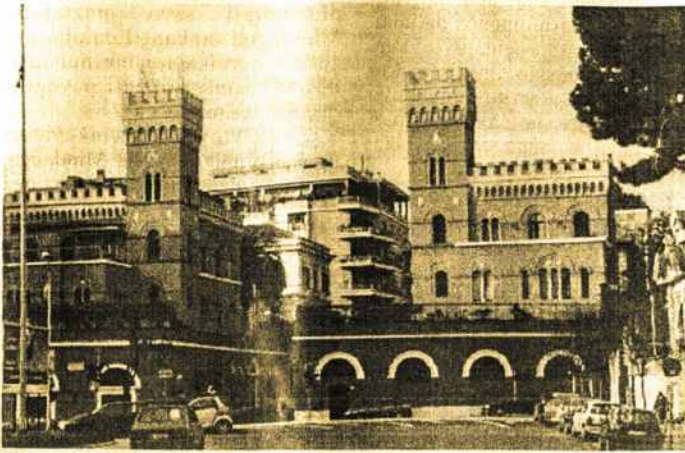
Popiežinė Šv. Kazimiero Lietuvių Kolegija