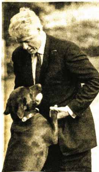
Rūmų pievelėje prezidentas mėgsta žaisti su savo šunimi Buddy.