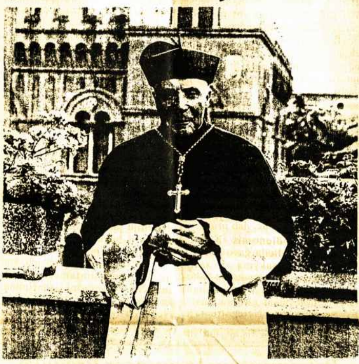
KARDINOLAS VINCENTAS SLADKEVIČIUS

1959 metų pavasarį, tik 39 metų amžiaus vyskupas V. Sladkevičius atkakliai priešinos ir nepaklūsęs saugumui bendrauti, ištremiamas į Nemunėlio