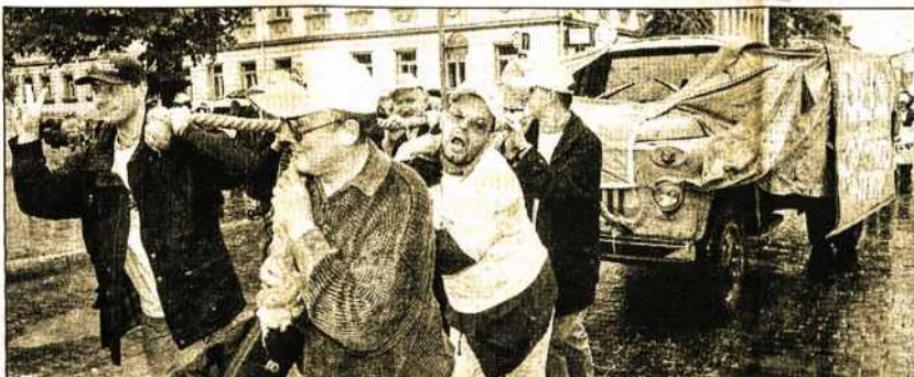
Vilniuje šeštadienį, Laisvės nuo mokesčių dieną, Gedimino prospekte tempiamas sunkvežimis simbolizavo mokesčių našta.

Taip Vilniuje buvo paminėta Laisvės nuo mokesčių diena. Tai diena, iki kurios statistinis šalies pilietis sumoka visus privalomus