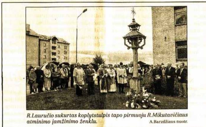
R. Lauručio sukurtas kopylytstulpis tapo pirmuoju R. Mikutavičiaus atminimo įamžinimo ženklu.