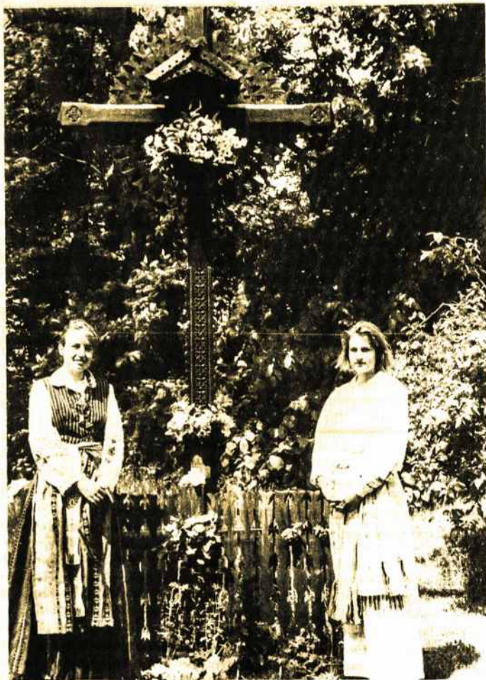
Anglijos Lietuvių Sodyboj sargyba prie Kryžiaus

Ar Nojus tikrai buvo 600-ų metų senukas, kai pastatė arką? Tikrai abejoju. Sužinojau, kad tai yra tik pasakos, kurios atskleidžia gilesnę dvasinę tiesą. Taigi Šventosios Dvasios įkvėpto Švento