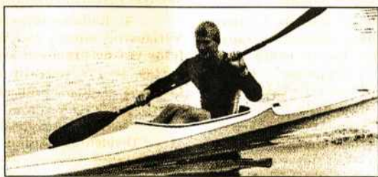
A.Duonėla žemyno pirmenybių aukso medalį iškovojo Lenkijoje.