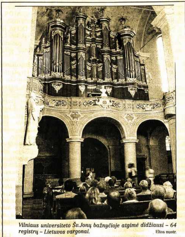
Vilniaus universiteto Šv. Jonų bažnyčioje atgimė didžiausi - 64 registrai - Lietuvos vargonai.