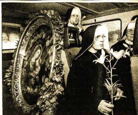
„Gražiosios Meilės Motiną“ į Pažaislį lydėjo kazimierietės.