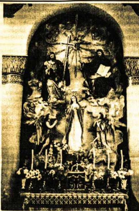
Lietuvių šv. Kazimiero bažnyčios altorius (medžio drožinys) Londone

Toks yra Bažnyčios idealas, nuolat liekantis kaip siekinys. Mus stiprina tikrumas, kad Dievas mus myli, kad jis atleido nuodėmes, kad yra gailestingas. Tai suvokiant, spontaniškai kyla atsakas - Dievo garbinimas ir džiaugsmas juo. Tai jau yra pratinimasis prie dangaus ir jo įžvalga - juk dangus ir reiškia nuolatinį džiaugsmą geruoju gailestinguoju Dievu. Marijoje Dievas padovanojo mums laimingo, visaverčio žmogaus pavyzdį. "B.Z."