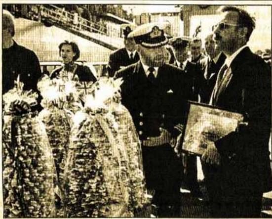
Šakočiams prireikė beveik 400 kiaušinių.

Britanijos jūrininkai kelis vakarus šėlo Klaipėdos baruose, kur alkoholinių gėrimų kainos jiems atrodė juokingai mažos. "Lr."