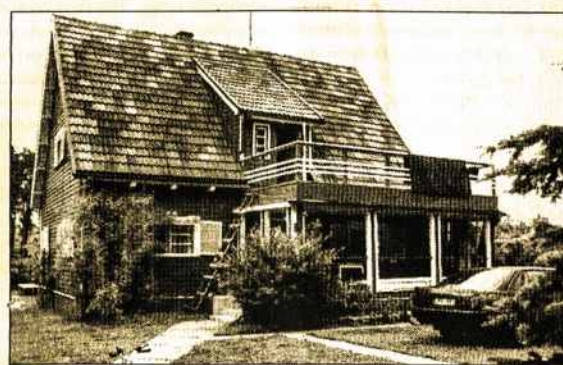
Šiemet V.Landsbergio giminės susirinko į atnaujintą vilą Kačerginėje.